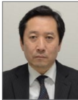
大石 人士 氏 一般財団法人 静岡経済研究所 常務理事