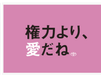
▲トヨタ「ReBORN」キャンペーン