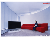
▲シャープ液晶テレビ「アクオス」